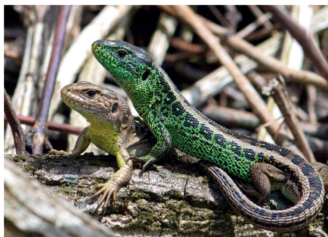
Während der Paarungszeit leuchten die Männchen der Zauneidechsen grün. Die Weibchen sind das ganze Jahr braun-grau mit hellen Flecken.

Die Zauneidechse Lacerta agilis ist eine charakteristische Mittellandart. Sie ist auf der Alpennordseite heimisch und lebt in Höhenlagen unter 1000 m. ü. M. Im Kanton Luzern kam sie einst fast flächendeckend vor. Heute sind ihre Vorkommen stark ausgedünnt. Gute Bestände finden wir noch in den Ausläufern des Napfberglandes und in der Umgebung der Wauwilerebene. Ihr natürlicher Lebensraum sind Trockenwiesen mit lückigen, kahlen Bereichen, die sie auch für die Eiablage nutzt. Durch die früher kleinstrukturierte